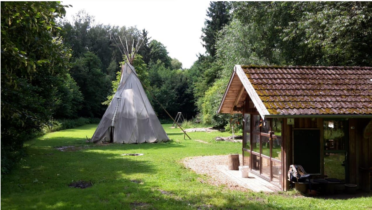
Foto Lichtung mit Hütte, Tipi